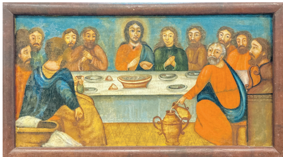
«Тайная вячэра», пачатак XIX ст.