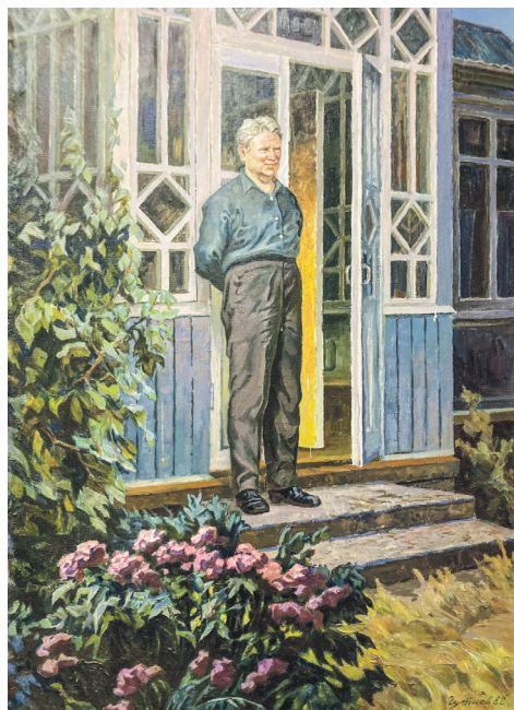
Мікалай Гуціеў «Максім Танк», 1982 г.

Неяк да мяне прыйшла думка, што, калі б хто з супрацоўнікаў статыстыкі пералічыў колькасць тэленавітых людзей на душу насельніцтва нашай краіны, то, напэўна, высветлілася б: Беларусь у лідарах. Усе аўтары, творы якіх прадстаўлены на выстаўцы, — беларусы. Няхай хтосьці з іх нарадзіўся па-за межамі