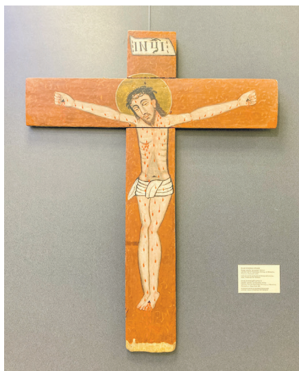
«Паклонны крыж», XVIII ст.

У Мастацкай галерэі Міхаіла Савіцкага некаторы час таму адкрылася выстаўка старажытнабеларускага сакральнага мастацтва «33 ступені» — сумесны праект Музея гісторыі горада Мінска і аддзела старажытнабеларускай культуры Цэнтра даследаванняў беларускай культуры, мовы і літаратуры Нацыянальнай акадэміі навук Беларусі. Ён знаёміць з гісторыка-культурнымі каштоўнасцямі сакральнага мастацтва, прысвечанымі евангельскім падзеям Крыжовага шляху Ісуса Хрыста, і прымеркаваны да свята Вялікадня. Убачыць унікальныя экспанаты можна да 19 мая.