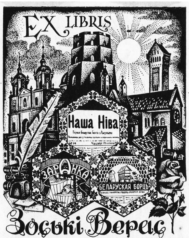
«Exlibris Зоські Верас». Целеш Вячаслаў Міхайлавіч. ЛММБ 011233