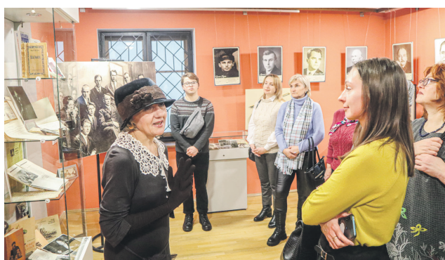
Выстаўка да 100-годдзя часопіса «Полымя».

Што ўяўляюць сабой часовыя экспазіцыі? Значнай нагодай для іх правядзення з'яўляюцца і каляндарныя святы. Вось як музей можа павіншаваць з Новым годам сваіх наведвальнікаў? Ёлка? Ну, гэта само сабой. Магчыма, нейкія ўрачыстасці? Так, абавязкова. Але чаму б не парадаваць гасцей і тым, што ўмее лепш за ўсё — тэматычнай экспазіцыяй? У фае галоўнага будынка акурат праходзіць такая імправізаваная выстаўка. За вітрынамі — паштоўкі-віншаванкі. Падпісаныя,