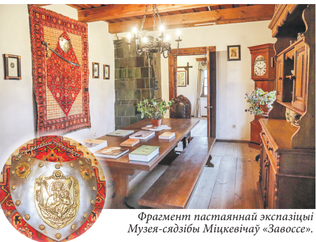
Фрагмент пастаяннай экспазіцыі Музея-сядзібы Міцкевічаў «Завоссе».

з'яву, як спосаб адлюстравання часу. Калі задумацца, уплыў на яе аказваюць не толькі гісторыя дзяржавы альбо палітычна-грамадскі бок жыцця, але і геаграфія, і нават біясфера той часткі планеты, дзе яна ўзнікае.